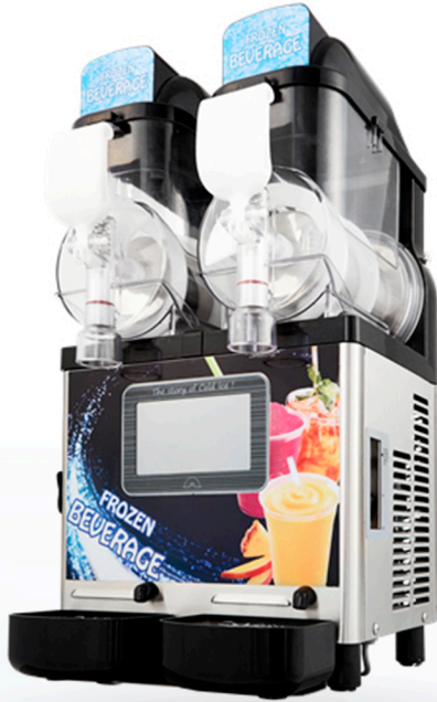
Pantalla táctil LCD