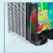
Filtro de aire