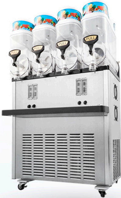
Granita y batido