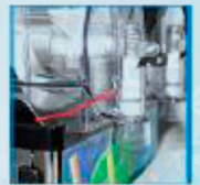
Mecanismo de orientación de goteo