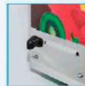
Tapa de drenaje

El tiempo de producción puede variar dependiendo la temperatura ambiente, la temperatura de la mezcla y la humedad.